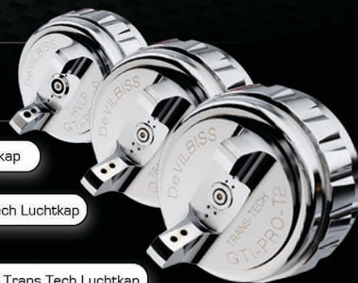
H1 HVLP Luchtkap

Het lichtgewicht en ergonomisch gevormde aluminium pistoolhuis, de no-kick luchtklep, plus de keuzemogelijkheid uit drie sublieme nieuwe luchtkappen, de H1 HVLP luchtkap en de T1 en T2 TransTech luchtkappen, verzekeren u dat de GTI PRO onderbeker-en de persvoedingspistool de beste keuze zijn voor spuiters die "de grote jongens" afwerken.